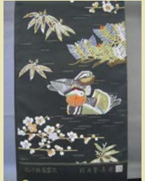
袋帯 ¥128,000 (通常価格 ¥380,000) 人間国宝羽田登喜男監修の袋帯

山形県の白鷹町は白鷹お粥しの産地としても知られていますが機屋さんの数も今では軒となり年間生産量も80万足らずとなった貴重な織物です。