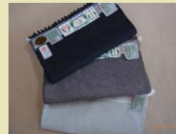
本場結城紬 ¥300,000~ (通常価格 ¥780,000)