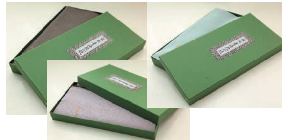
化粧箱入 江戸小紋 ¥38,000 (通常価格 ¥80,000)