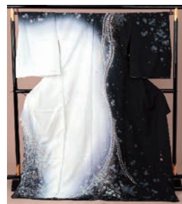
吉野一廉作紋訪問着 ¥88,000 (通常価格 ¥380,000)