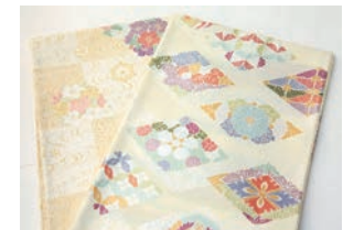
丸勇織物袋帯 ¥28,000 (通常価格 ¥78,000)