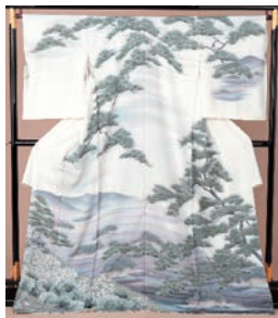
京友禅訪問着 ¥78,000 (通常価格 ¥280,000)