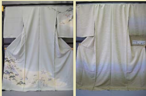
友禅訪問着 ¥238,000 (通常価格 ¥880,000) ぼかし訪問着 ¥98,000 (通常価格 ¥280,000) 京友禅作家二代目上野為二