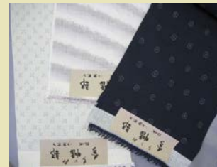
石下結城紬 ¥98,000~ (通常価格 ¥280,000)

小倉商店は結城紬の産地問屋で、本場結城紬だけではなくオリジナルブランドの「今幡部」を手がけるメーカーです。