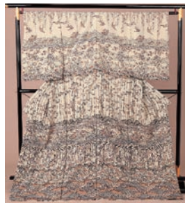
京友禅総柄訪問着 ¥78,000 (通常価格 ¥280,000)